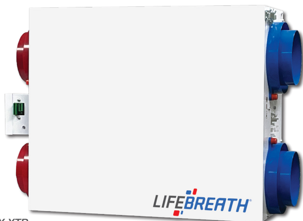
MAX XTR 184 PCM @ 0.3 (75) IN. W.G. (PA)