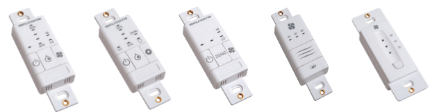
99-BC02 99-BC03 99-BC04 99-DET02 99-DET01

Augmente la portée des minuteries sans fil 99-DET02. Se branche dans une prise de courant de 120 V. Connectivité sans fil entre la commande principale et à la minuterie 99-DET02. Installation à mi-chemin entre la minuterie et la commande principale au mur si la minuterie est hors de portée.