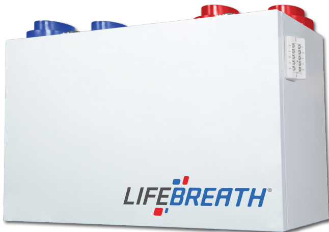
130 ERVD 153 PCM @ 0.3 (75) IN. W.G. (PA)