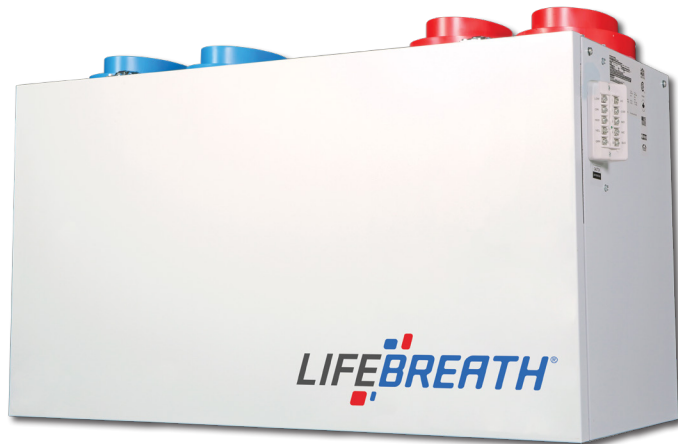
267 MAX ERV 278 PCM @ 0.3 (75) IN. W.G. (PA)